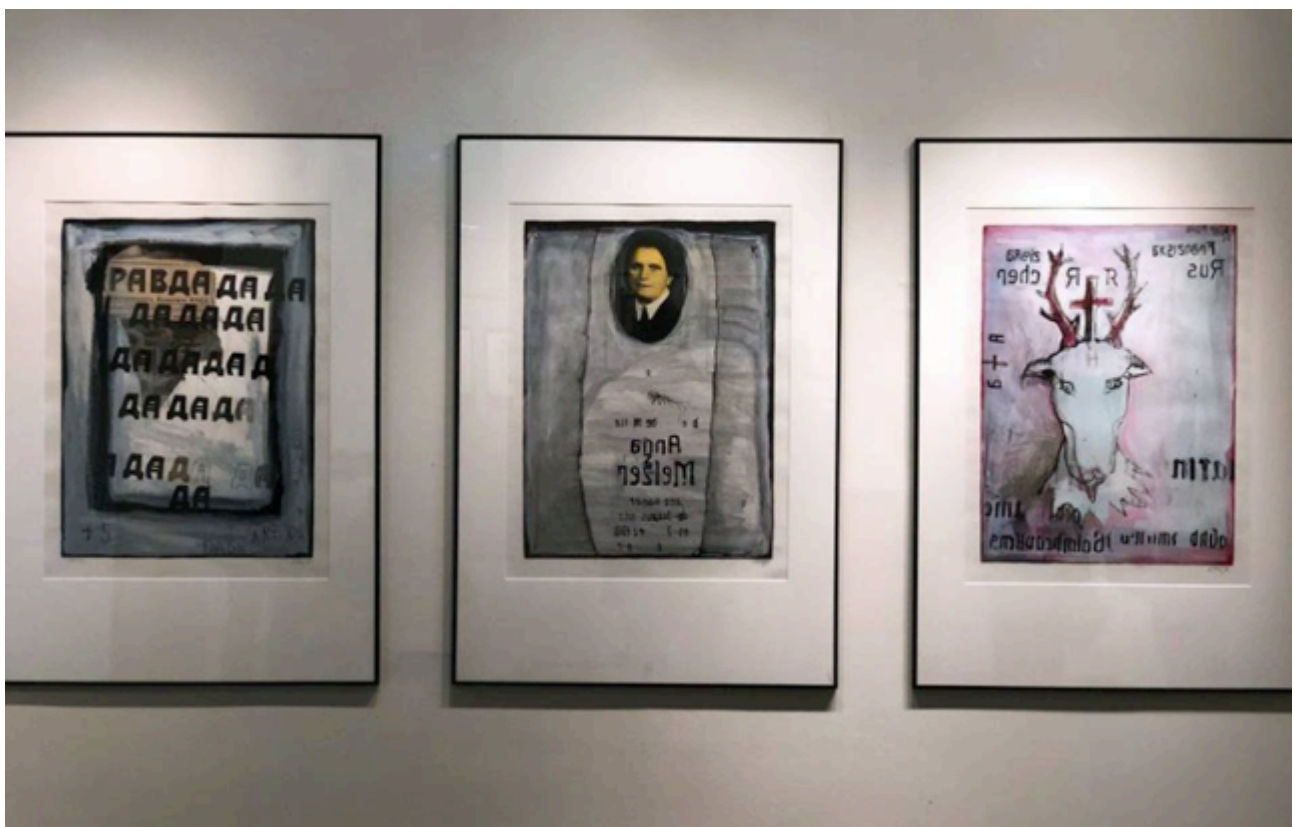
Pohled do výstavy Luboš Plný: Zachovalé ostatky