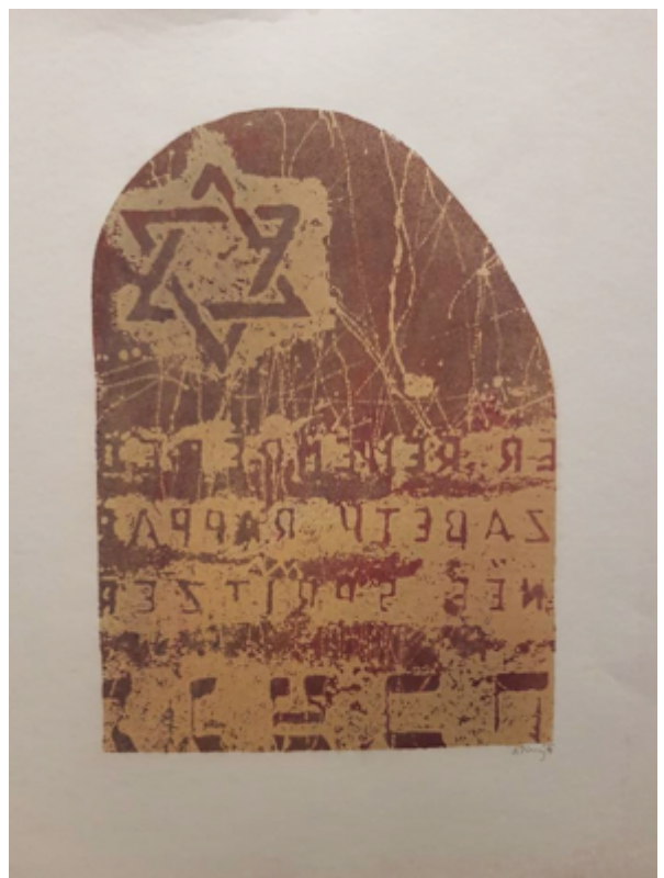
Luboš Plný: Hřbitovy